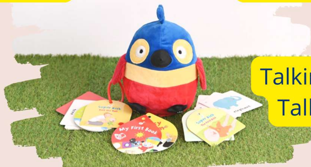
Talking Kaboo & Talking Cards